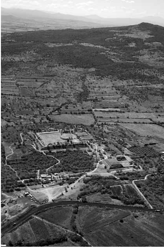
FIGURA 2. Fotografía aérea de Peralta, destaca en el paisaje el conjunto de Doble Templo y patio hundido y el Recinto de los Gobernantes con la estructura circular a la izquierda del patio hundido