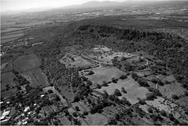
FIGURA 1. Fotografía aérea del sitio arqueológico de Zaragoza